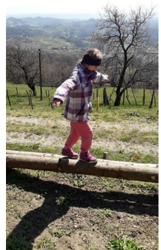
Teja na svojem poligonu