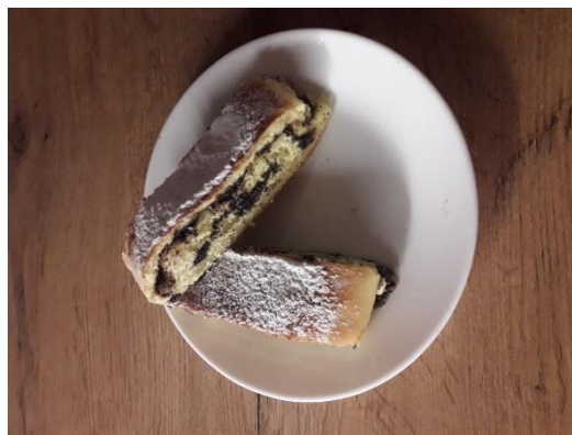
Tinkarina domača potica

Zadnji šolski dan 4. tedna učenja na daljavo smo v Pišecah izvedli tehniški dan na temo priprave na veliko noč. Učenci so dobili vsa navodila, nato pa se samostojno ali ob pomoči staršev lotili dela. Nekateri so se preizkusili v barvanju pirhov, izdelavi podstavkov zanje, spet drugi so raziskovali o prazniku in njegovih običajih, tretji so se smukali po kuhinji in pripravljali slastne dobrote, četrti so se odločili za velikonočne igre in iskanje zaklada, ki jim ga je pustil velikonočni zajček. Vsi pa smo enotni, da nas letošnja velika noč še bolj povezuje in druži in bo kot posebna šla v našo zgodovino.