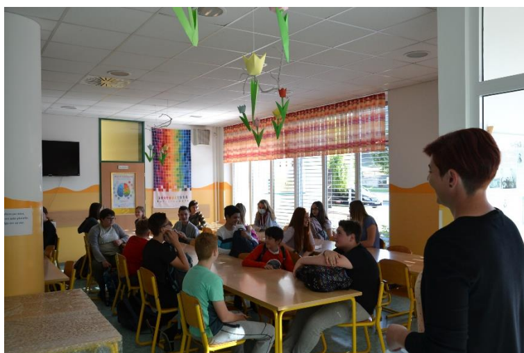
Učenci od 6. do 8. razreda

V sredo, 3. 6., so se v šolo vrnilo še učenci 6., 7. in 8. razredov. Tako kot je običaj, najprej navodila v jedilnici, nato pa srečanje z učitelji v razredu.