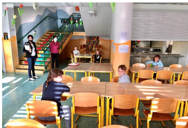
Učenci prve triade